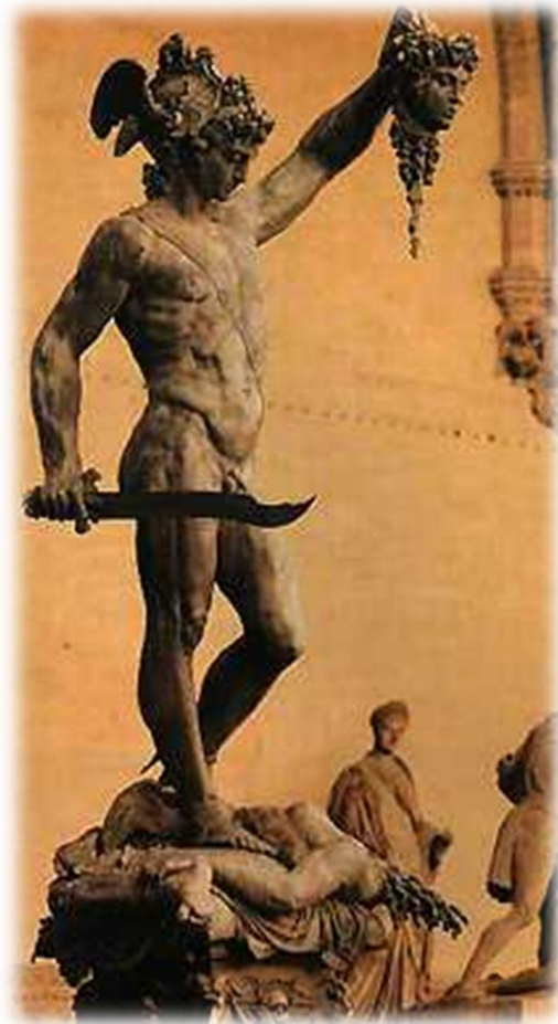
Perseu amb el cap de la Medusa, Benvenuto Cellini, 1545-54, Loggia dei Lanzi, Florència.

Al cap d'un temps els rei va descobrir el nen i per desfer-se d'ell i de la seva filla els va tancar dins un cofre de fusta, i els va llençar al mar. Van anar navegant fins a l'illa de Sèrifos, on Dictis els va acollir. Polidectes, el rei de Sèrifos es va enamorar de Dànae i per allunyar Perseu de la seva mare li va demanar que portés el cap de la gorgona Medusa.