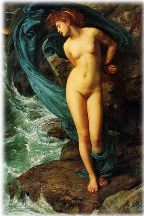
Edward John Poynter. Oli sobre tela. 1869. Col·lecció privada.

Però Perseu va sentir els crits de la donzella i va córrer a ajudar-la. Va treure el cap la gorgona per ensenyar-lo al monstre i es va quedar transformat en pedra a l' instant, enfonsant-se en l'aigua.