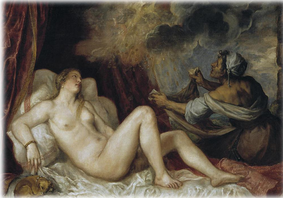
Tiziano Vecellio. Olí sobre tela. (1553-1554) Museo del Prado (Madrid)

Acrisi, el rei d'Argos, va tancar la seva filla Dànae perquè sabia per un oracle que moriria en mans del seu nét. Quan Dànae estava tancada, el déu Zeus se'n va enamorar i per arribar fins a ella es va transformar en una pluja daurada. Dànae va concebre i donar a llum en secret un nen, a qui va anomenar Perseu.